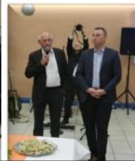
6 novembre - la rando se prépare ..... et se restaure