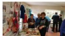
18 novembre - Journée du nouvel arrivant